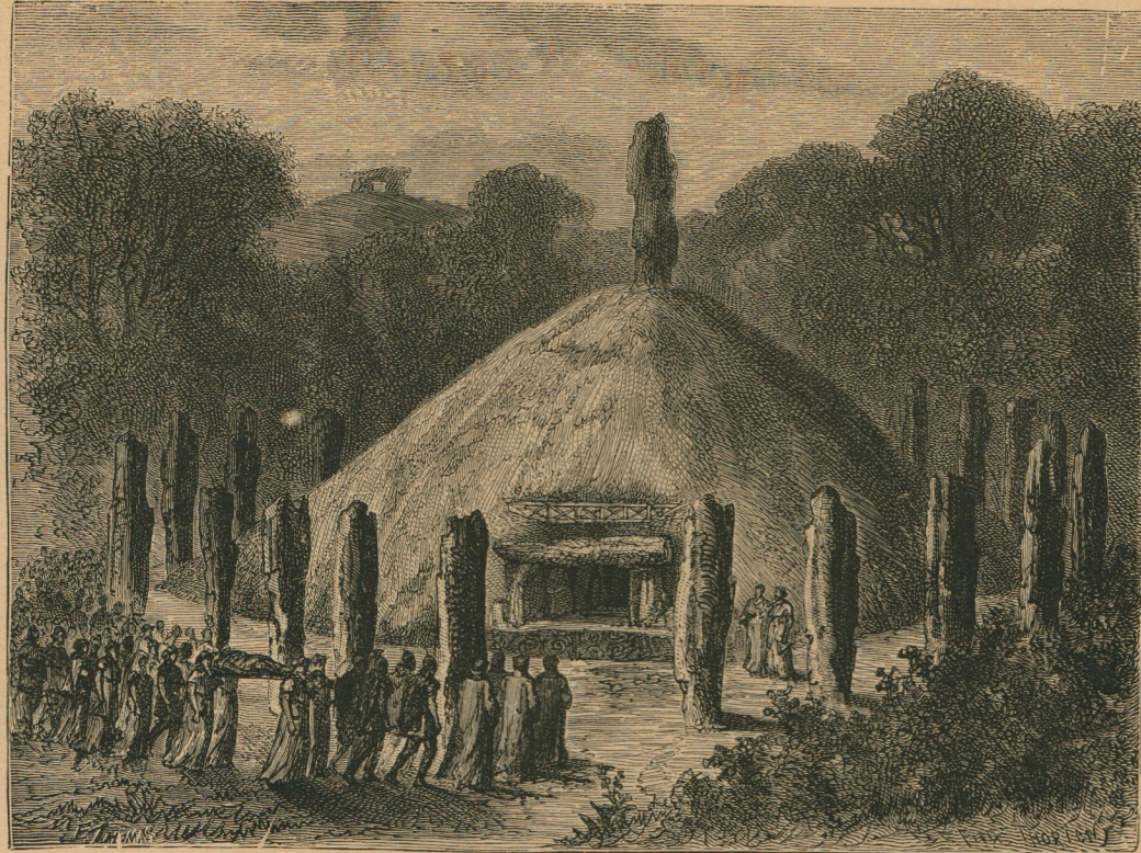
13. — Tumulus entouré d'un cercle de menhirs. — Funérailles gauloises. Grafheuvels met menhirs rondom. — Gallische lijkplechtigheden.