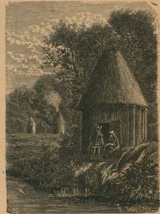
12. — Habitations gauloises. Gallische woningen.