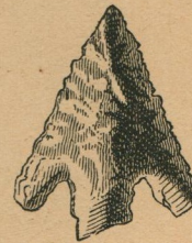
8. — Pointe de flèche en silex taillé. Pijlspits van gescherpten vuursteen.