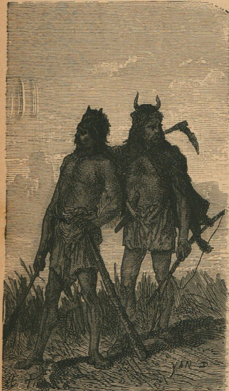
11. — Les premiers habitants de la Gaule. Eerste bewoners van Gallië.