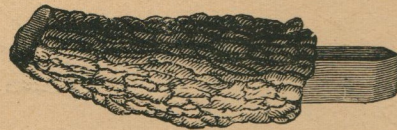
7. — Ciseau en silex poli avec manche en bois de cerf. Beitel van geslepen vuursteen met steel van hertshoorn.